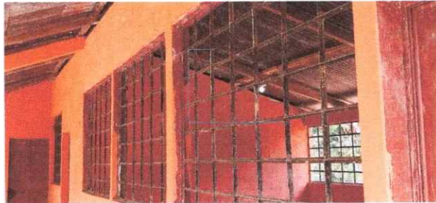
Foto 3: se observa las metalicas de las ventanas oxidados de de las aulas del establecimiento.