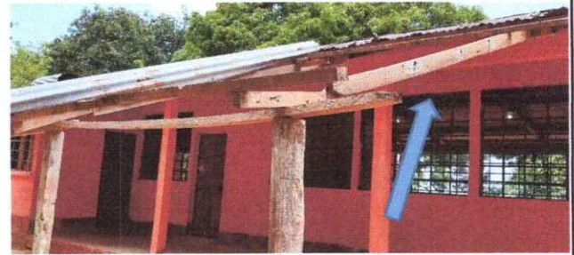
Foto 2: se observa costeneras y tigas picadas por comejenes se ve inservible todas